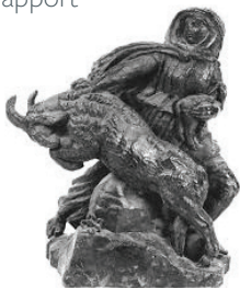
▲ Le Bélier rétif Antoine Bourdelle Collection musée d'Orsay

Dans un monde où les bouleversements climatiques nous amènent à repenser notre rapport au monde, cette exposition souhaite questionner notre positionnement face à la nature, et particulièrement la relation homme-animal, entre domination et prise de conscience. Elle réunit des œuvres variées : peintures, sculptures, céramiques, photographies et tapisserie dans une même intention : ouvrir le dialogue. Ainsi autour du chef-d'œuvre d'Antoine Bourdelle, Le Bélier rétif , qui symbolise un rapport d'exploitation et de contrainte, plusieurs œuvres permettront de se questionner sur d'autres modes de cohabitation avec les animaux.